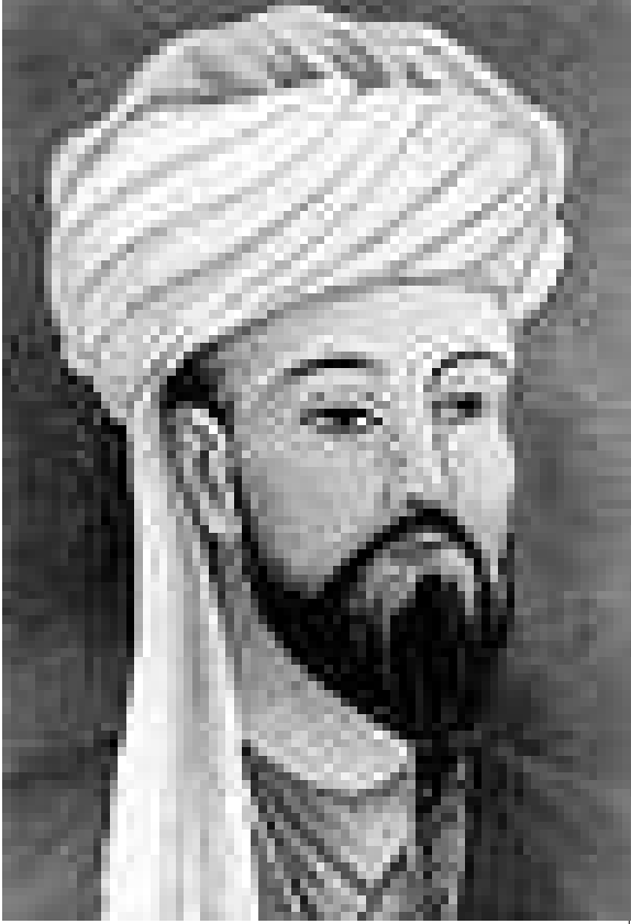
Nasi al-Din al-Dusi

டிலின் தத்துவங்கள் மேற்கத்தைய வாசகர்களைக் கிட்டியது. 13ம் நூற்றாண்டு வானசாஸ்திர கணித வல்லுனர் Nasir al- Dinal - Tusi எழுந்திராவிட்டால் copernicas புரட்சியே ஏற்பட்டிருக்காது.